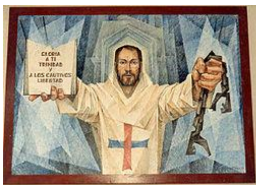
Saint Jean de Matha

Les Trinitaires portent, depuis la fondation, un habit blanc sur lequel il y avait la croix rouge et bleue.